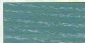
NO 214 + NO 200