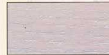
NO 218 + NO 200