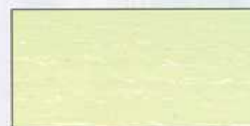
NO 213 + NO 200