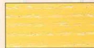
NO 209 + NO 200