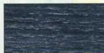
NO 211 + NO 200