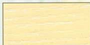
NO 205 + NO 200