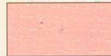
NO 215 + NO 200