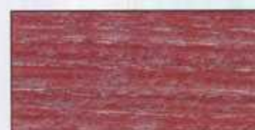
NO 210 + NO 200