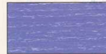
NO 221 + NO 200