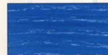
NO 224 + NO 200

"Ne pas appliquer sur supports humides, gras, condensants, gelés ou présentant des micro-organismes en surface"