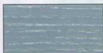
NO 201 + NO 200