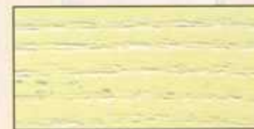
NO 206 + NO 200