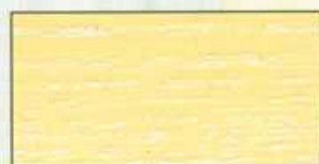
NO 208 + NO 200