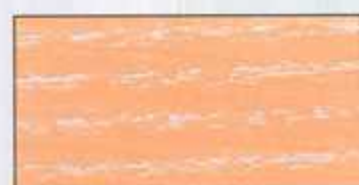
NO 207 + NO 200