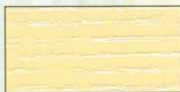
NO 202 + NO 200