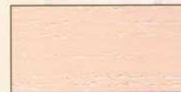
NO 212 + NO 200