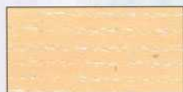
NO 204 + NO 200