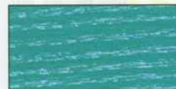
NO 220 + NO 200