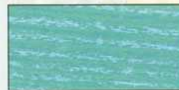
NO 217 + NO 200