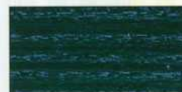
NO 223 + NO 200