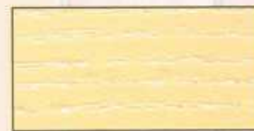
NO 203 + NO 200