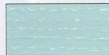
NO 219 + NO 200