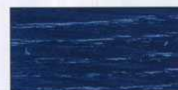
NO 222 + NO 200